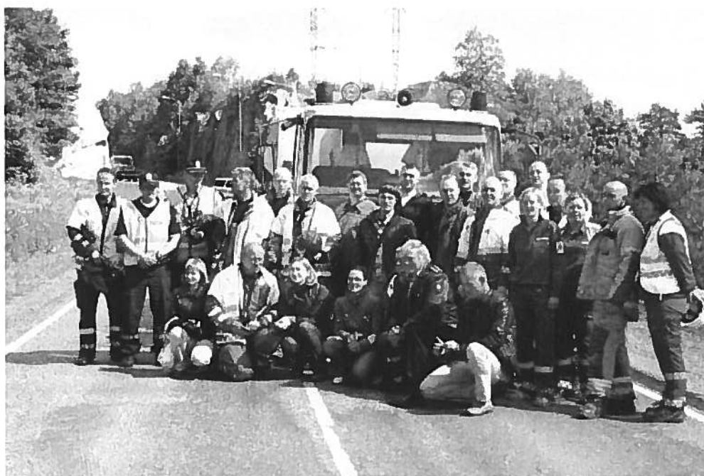
UF Larvik og besøkende fra Litauen.

Dette er en flott måte å treffe kolleger fra et annen land samt å spre UF ånden over grensene